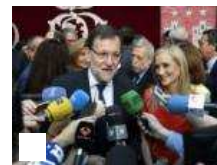
El presidente del Gobierno y del PP,