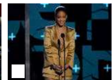
Rihanna se convierte en la artista con más