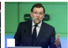
El gobierno español agotará legislatura,